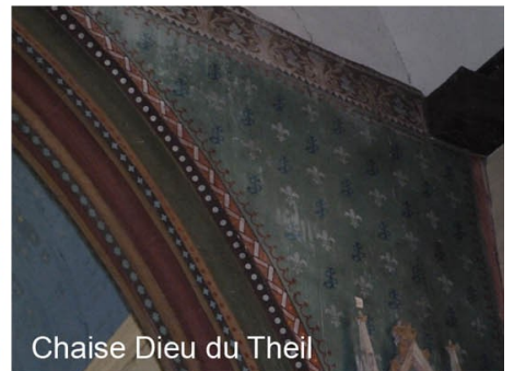
Chaise Dieu du Theil