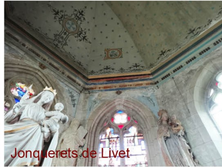
Jonquerets de Livet