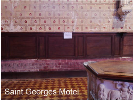
Saint Georges Motel