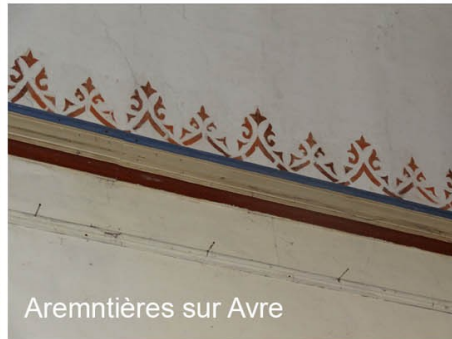
Aremntières sur Avre