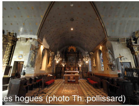
Les hogues