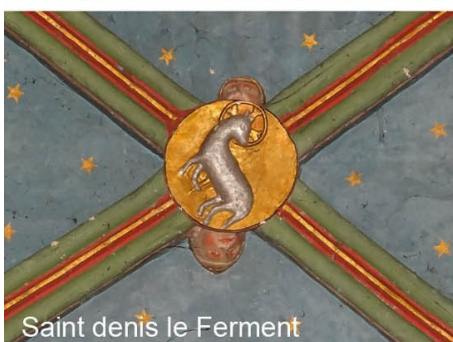
Saint denis le Ferment