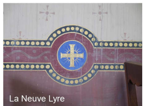
La Neuve Lyre