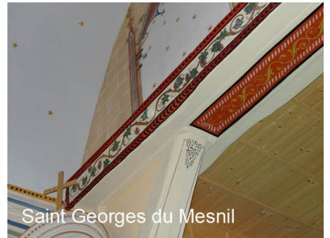
Saint Georges du Mesnil