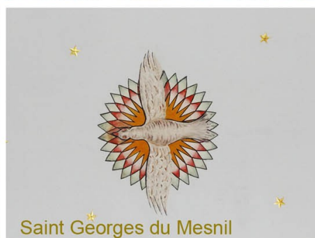
Saint Georges du Mesnil