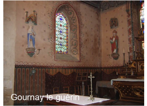
Gournay le guérin