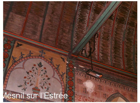
Mesnil sur l'Estree