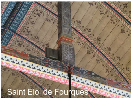
Saint Eloi de Fourques